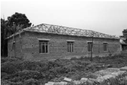
Das erste Gebäude ist fertiggestellt.

Mit dem Erlös wollen wir in diesem Jahr je zur Hälfte die Arbeit von Misereor vor Ort in Indien und den Bau des katholischen Kindergartens in unserer Partnergemeinde Mlangali unterstützen.