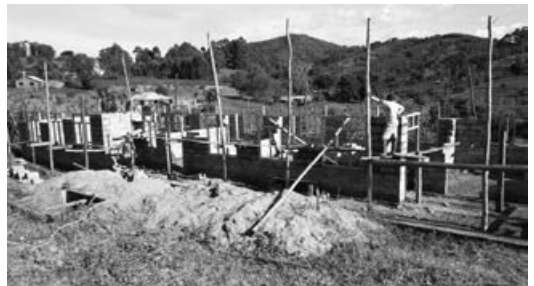
Mit dem Bau des zweiten Gebäudes wurde begonnen.