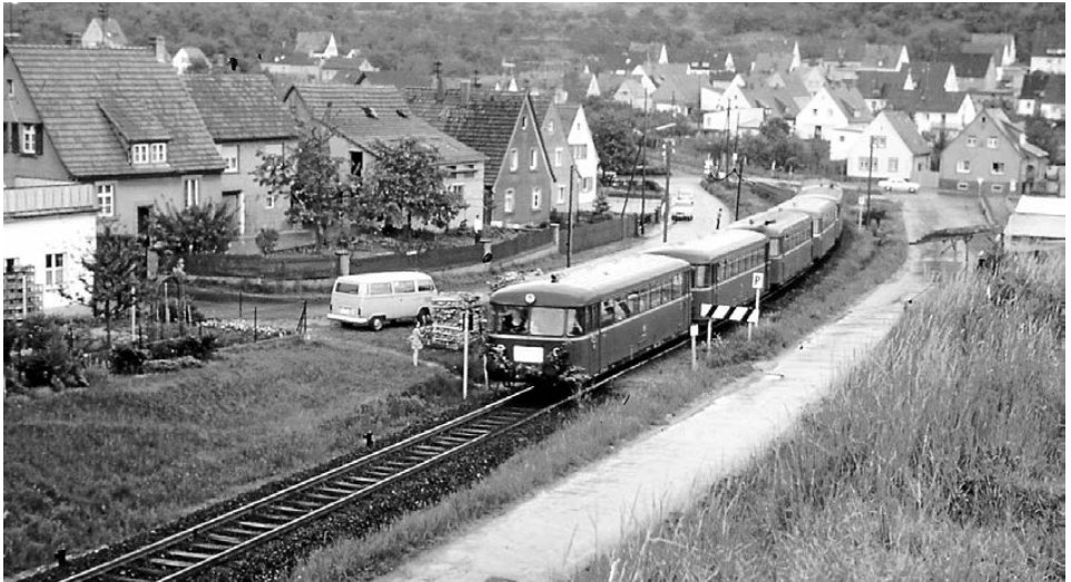
Der letzte Zug verlässt am 25. Mai 1974 Mömlingen

Auf einen unterhaltsamen Mümlinger Owend freut sich Euer Heimat- und Geschichtsverein Mömlingen!