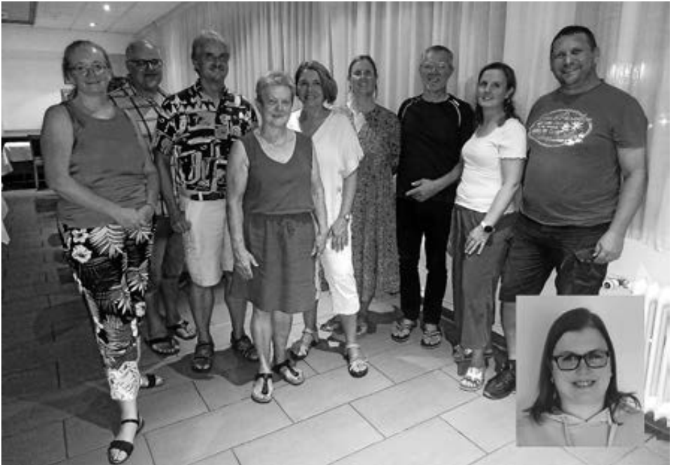
Vorstand Freundeskreis Mömlingen-La Rochette

Juli 2025: deutsch-französische Jugendbegegnung in Mömlingen.